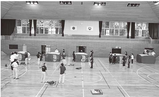
▲パーティション設置の様子

8月12日(水)役場職員と女性消防団で防災訓練を行いました。新型コロナウイルス流行下での避難を想定しており、非接触での体温検査、ダンボールベッドとパーティションの設置、ソーシャルディスタンスをとった距離での案内を実践しました。