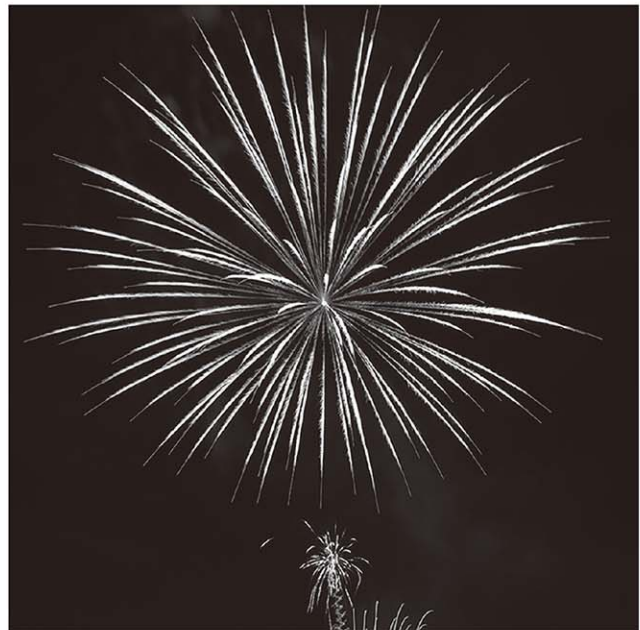
▲打ち上げられた花火