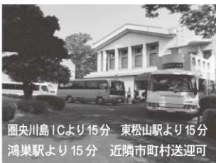
圏央川島ICより15分 東松山駅より15分 鴻巣駅より15分 近隣市町村送迎可

URL http://www.friend-yoshimi.co.jp 埼玉県比企郡吉見町黒岩 602