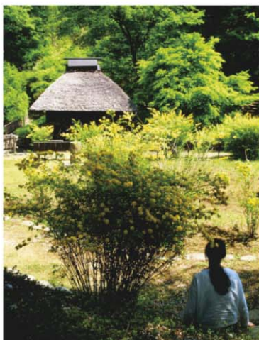
フジクローム賞 『くつろぐ春』 長谷重雄さん（上野二）