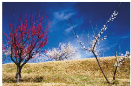
フジクローム賞 『早春』 長谷重雄さん（上野二）