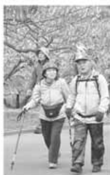
問総務課 自治振興担当