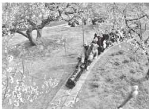
問(出)越生町観光協会