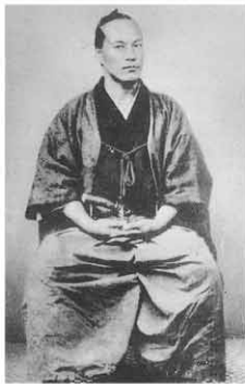
山岡鉄舟

大河ドラマ『西郷どん』に因んで、幕末維新の人物を取り上げてみました◆西郷隆盛と交渉し、「江戸無血開城」に尽くした「幕末の三舟」の一人山岡鉄舟は、越生の正法寺に参禅し、山門と閻魔堂の扁額を揮毫しています◆津久根村で生まれ、江戸新吉原で成功を収めた尾張屋（新井）三平は、黒山三滝を世に広めた功労者でもあります。鉄舟と同じく、北辰一刀流祖の千葉周作のもとで剣の腕を磨き、一方、遊侠無頼の徒と交わり、新門辰五郎と義兄弟の契りを