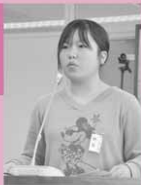
瀬戸桃花議員 (越生小)

Q 越生町には狭い道や歩道がない道があります。車いすやベビーカーは道から出て危険です。車道や歩道などを整備して、事故が起こらない安全な町にしてください。