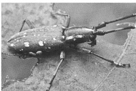
イチジクの葉上のキボシカミキリ

ミキリで重要なことは、西日本に分布する系統と、関東で1930年以降から発生した系統は同じ亜種であるものの、性質が異なることです。すなわち、東日本系統は、台湾や中国大陸系統と休眠特性などが一致したこと、東京から分布拡大をしたことから、外来種とされています◆日本列島には、前記の1亜種の他に9亜種が分布します。主に南西諸島で亜種が形成され、屋久島・石垣島に8亜種、伊豆諸島の三宅島と御蔵島に1亜種が生息しています。日本の島々は、キボシカミキリの研究からも、東洋のガラパゴスであることが解明されつつあります。（江村 薫）