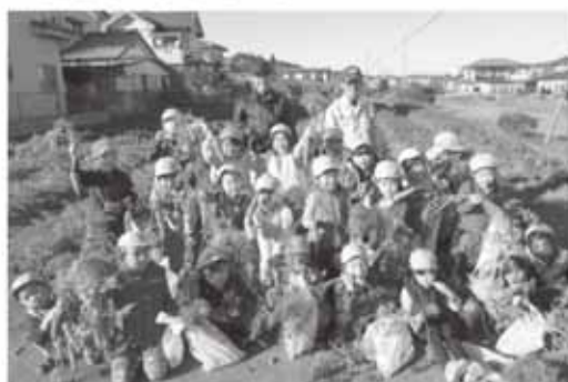
◀大きなにんじんがとれました

11月21日、上野ファームでにんじん抜き体験をしました。園児たちは「うんとこしょ、どっこいしょ」と力いっぱい抜き、土と葉のついたにんじんを観察できました。