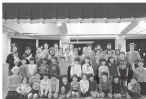
◀みんなでプレゼントを交換しました

12月22日、越生保育園でプレゼント会が行われ、越生町童謡を歌う会のみなさんが童謡を披露しました。園児たちも一緒に歌い、楽しく過ごしました。