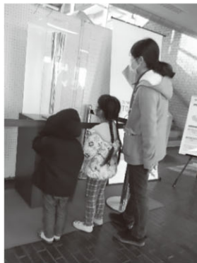
▲トーチを観覧するご家族

12月18日(金)に越生町中央公民館1階ロビーにて東京2020オリンピック聖火リレートーチを展示しました。約480名の方が来場され、桜ゴールドと呼ばれる美しい輝きをご覧いただきました。