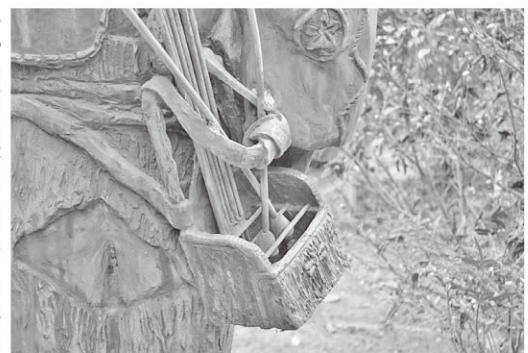
右腰に下げた簾と鎗矢（龍穩寺の道灌像）

龍穩寺の道灌像 道灌五百年忌にあたる昭和60年に建立された。川越出身の彫刻家で、川越市役所前の道灌像を制作した橋本次郎氏の作品です。高さ158cm、右手に山吹をひと枝を持つています。射籠手に描かれた「雁」は、道灌築城の河越城（別名初雁城）にちなんだデザインです。駅前の道灌像とは異なり「簾」と呼ばれる箱形の収納具に差し込んだ矢を携えています。