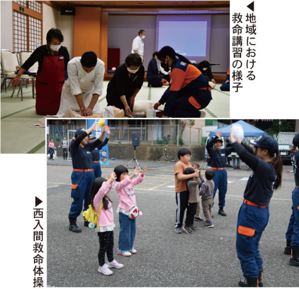
◀地域における救命講習の様子

消防団は、消防署と協力して、火災、災害及び人命の救助救出に活動するとともに、火災予防などの啓発普及活動を行います。消防団員は、それぞれ自分の仕事を持ちながら地域防災の担い手として、地域に密着して活動し、住民の安全と安心を守るという重要な役割をもっています。