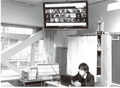
▲中学校では、家庭と学校をつないで接続確認などを行いました。(越生中)