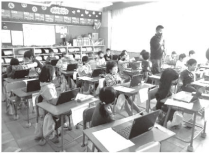
▲小学校低学年は、まずはパソコンの操作方法を学んでいます。(越生小)