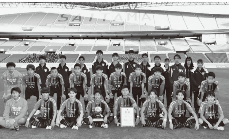
▲第99回 全国高校サッカー選手権 埼玉県大会 準優勝 埼玉スタジアム2002

本校は「行うことによつて学ぶ」という建学の精神のもと、創立68年を迎えた全日制の私立高校です。学年10クラス、千人を超える生徒が在籍しています。本校敷地内に教室棟3棟、体育館2棟、宿泊施設兼トレーニングジム、人工芝グラウンド、野球専用グラウンド、武道館などの施設があります。また、長野県軽井沢にも宿泊施設を有し、学校行事、部活動の合宿で利用しています。