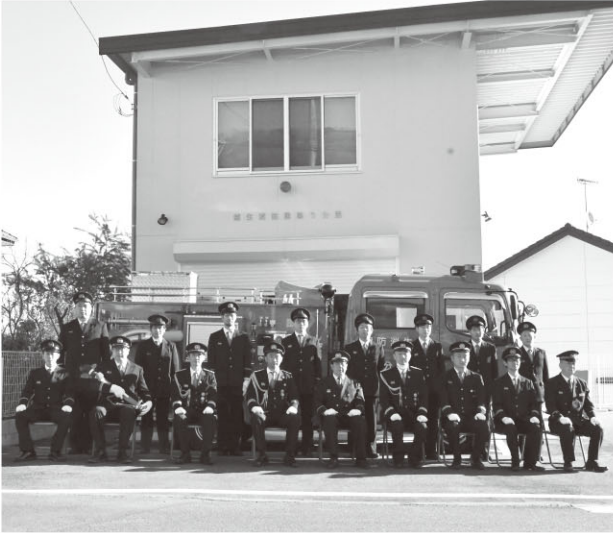
▲車両が新しくなりました

1月10日、越生消防団第3分団詰所で消防ポンプ自動車の引渡式が行われました。22年間共に活動してきた車両に感謝するとともに、新たな車両との活動が始まります。