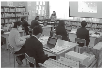
▲子供たちにパソコンを使った授業を提供するために、先生方の研修も行っています。(梅園小)

昨年11月に、越生町の小・中学校の子供たち一人一人にパソコンが、近隣自治体のどこよりも早く整備されました。パソコンを使ってコミュニケーションをとったり、情報を取り出し、活用したりする能力は、これからの社会を生き抜いていくために必要な能力となってきます。