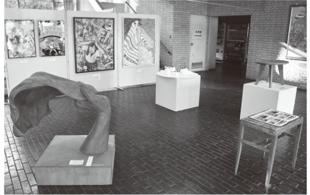
▲作品の展示の様子

1月8日～1月15日の間、中央公民館ロビーにて県立越生高校美術部の作品が展示されました。作品の中には全国大会にも出品された作品があり、多くの公民館利用者が鑑賞しました。