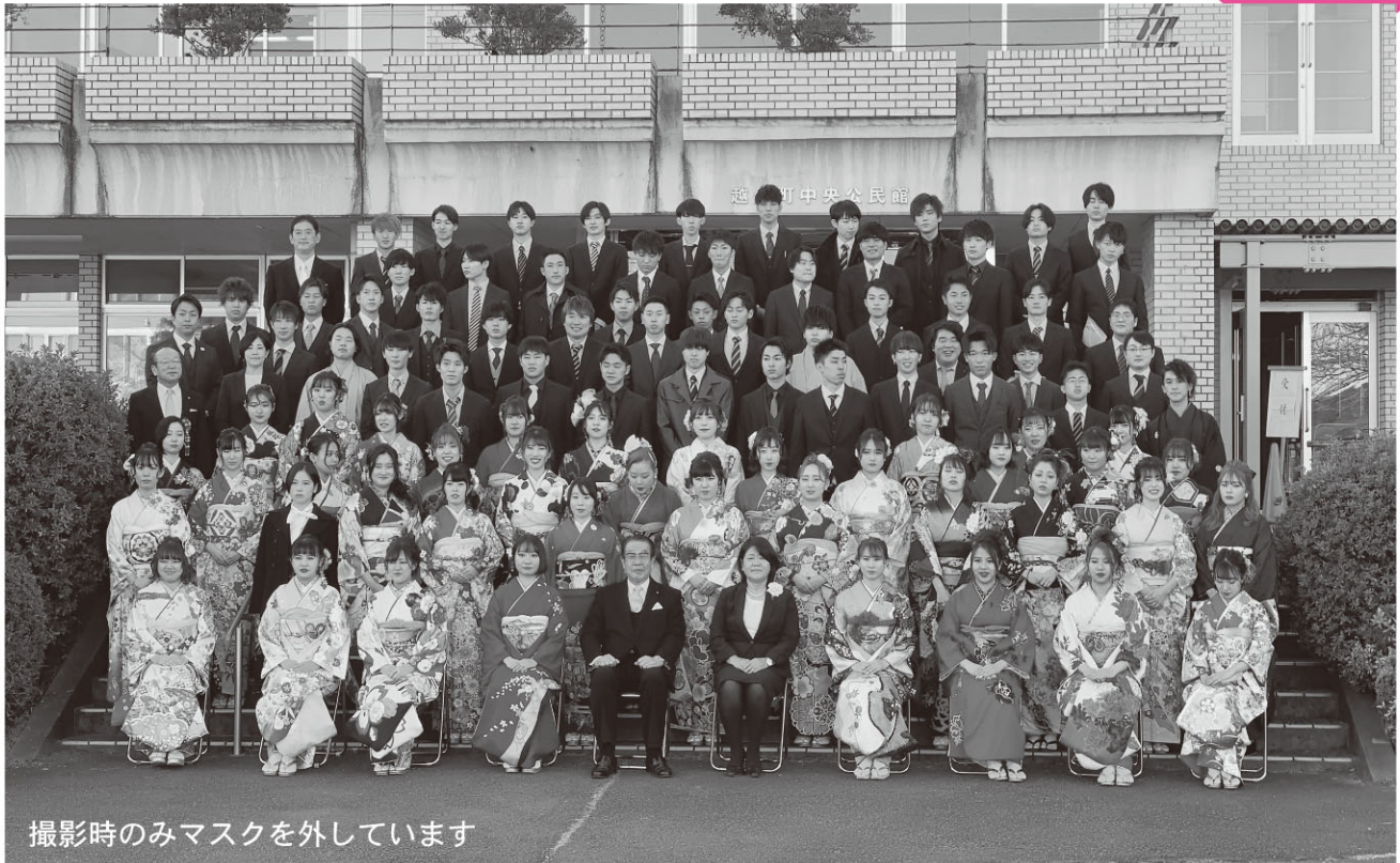
撮影時のみマスクを外しています