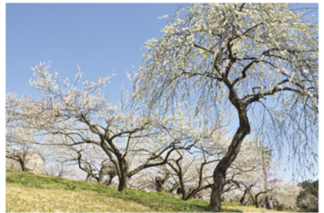
梅・満開 (越生梅林・堂山)