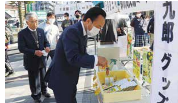
▲越生町のブースに立ち寄る富岡朝霞市長

11月7日、都市間交流先である朝霞市で開催されたASAKA STREET TERRACE 2021に越生町観光協会ならびに越生町特産物加工研究所がブースを出店しました。元氣百梅や柚子七味等を販売し、越生町の宣伝を行いました。