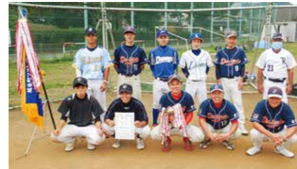
▲優勝した大満チーム