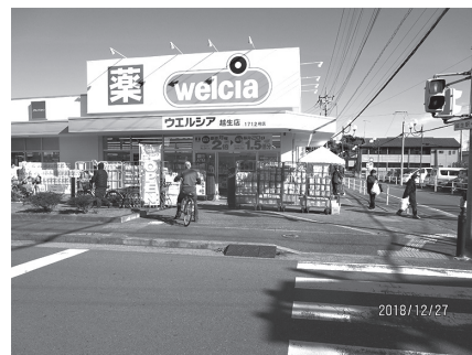
開店したウエルシア越生店

センターや社会福祉協議会で利用しているケースがある。開店後施設を拝見し検討したい。