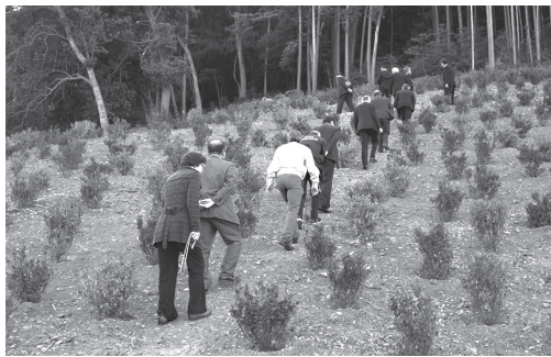
墓苑内を見て歩く議員

11月27日全員協議会において町から樹木葬墓苑の進捗状況の説明がありました。その後議員全員で現地視察に行きました。擁壁工事や排水処理工事がすでに終了し、1000本のつつじ植栽が完了している状態でした。 町長から1月以降には県の記者発表、2月には町民見学会、その後町民事前予約、4月から正式に受付開始となり、埋葬はつつじ祭り終了後を予定していると今後のスケジュールの説明がありました。