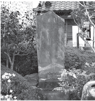
句碑は植え込みの中に