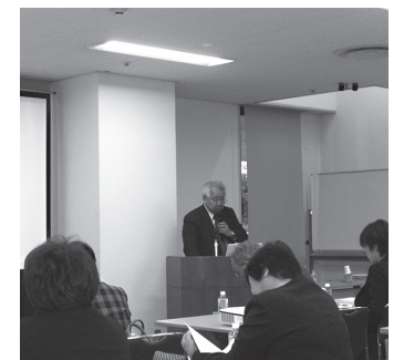
数多くの資料を投影しながらの解説