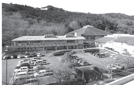
1982年に完成した中央公民館も老朽化が目立つ

③補助金を見つけ積極的に活用。④補助金や交付税で措置される起債、基金を活用。⑤広報やHPに掲載し町民にも考えてもらう。⑥残すにして