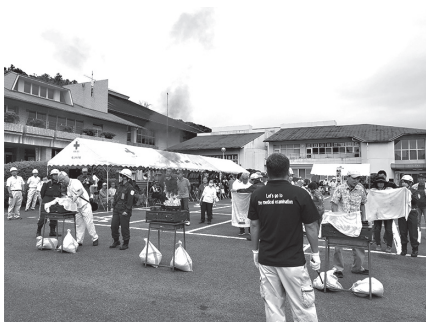
平成30年9月防災訓練