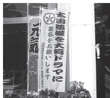
のぼり旗 (オーティック前)

問 太田道灌大河ドラマ誘致運動の高揚のため、次の提案をする。①太田道灌の講演会等の実施②道灌ゆかりハイキング③「道灌まつり」の実施④道灌のパフレットの作成。また、のぼり旗を多く立てること⑤11月7日道灌の子孫太田資曉氏等が来町したが内容はどうか。 答 ①及び②は実現・実施するよう努力・検討する。 ③目的・経費等を含め慎重に検討する。④パフレットは作成し旗は検討する。⑤大河ド