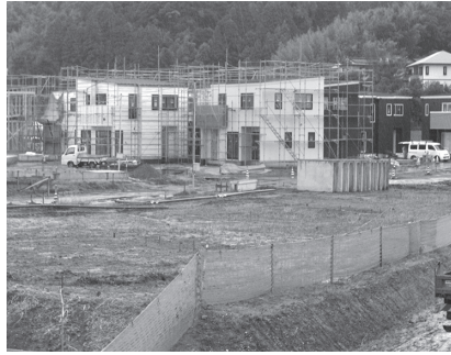
水田を宅地造成し住宅建設が進む

充当できるので家は無償譲渡し、土地のみを購入してもらうという説明には、思わずうなずいてしまいました。