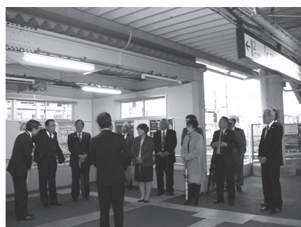
駅構内で説明を受ける議員

6月にJR東日本から町に無料譲渡される越生駅舎の検討が、越生駅舎活用検討委員会で進められています。そこで議会としても越生駅舎の現況を把握するため、12月3日の議会初日、本会議終了後に全員で視察を実施しました。 越生駅舎の外観、天井、柱、通路等、そして、通常は入室が出来ない事務所内部まで、見る事ができました。当日は、企画財政課の職員の丁寧な説明を受けながら駅舎内部等を確認しました。