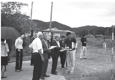
大字古池 町道1953号線・1954号線の廃止

その他、地方消費税交付金、地方譲与税、使用料及び手数料、ゴルフ場利用交付金等があります。