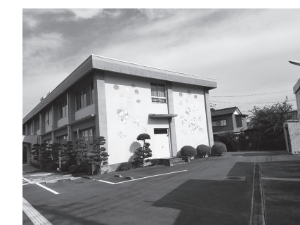
川越市神明町にある児童相談所

答 転入の場合は児童相談所に相談してケースを引き継ぎ、対応方法話し合う。虐待防止について近隣住民にできることにはどんなことがあるか。