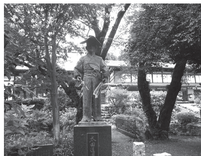
龍穩寺に立つ太田道灌像