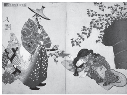
山吹の里に残る鷹狩伝説(江戸東京博物館所蔵)