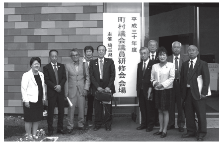
議員全員が「議会改革をめぐる最近の動向と課題」を研修