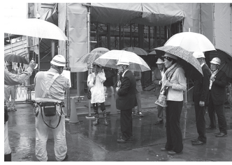
現場で説明を受ける議員

9月定例会最終日となった9月21日の本会議終了後に雨の中ではありませんでしたが、議員全員で建設中の越生駅東口の進捗状況を視察してまいりました。