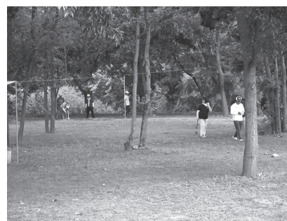
パークゴルフを楽しむ人たち

車の税制上の優遇措置は。③ 庁用車にEV車を採用しない 理由は。④近隣で採用したE Vスタンドが軽費でできた国 の補助制度を知っていたか。 ⑤EVスタンド設置の考えは。 ①30年度課税台数で9 324台、軽2台を含む 13台がEV車。②新車の場合、 取得税が非課税、重量税が免 税、2年目以降は自動車税75 %軽減。③庁用車35台のうち 4台がHV車。充電に時間を 要し、価格も高額。④承知は していたが、時期尚早と判断