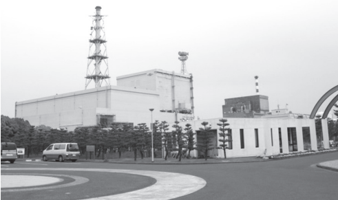
東海第二原発