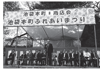
ふれあいまつりの壇上で 議長が越生町をアピール