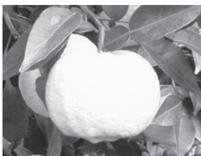
ゆずの果皮の活用を！