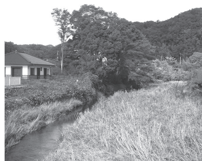
葦が繁茂する越辺川

に際し内容を分かりやすくし、また情報伝達体制を定めるなど、防災計画を見直す。 問 当町に、過去何度も大きな水害等があったことを忘れるべきではない。これを前提に災害対策をすべきだ。①越辺川は葦が繁茂して河床が上がり、放置すると洪水の危険を増す。葦の除去・土砂の浚渫を管理者である県に要望すべきだ。②豪雨時に脆弱な場所が町内にある。その治水対策を県に要望すべきだ。