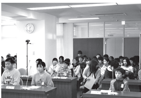
開会を待つ未来の議員候補たち(子ども議会)

聴は誰でも自由にできるが、平日の議会開催では、これも限られてしまう。近隣の町議会ではケーブルテレビで録画放送をし、他ではインターネットを通じて、音声による議会での発言の様子を配信している。ライブではないが、町民は都合のよい時間に聞いた議員の発言内容を聴くことができる。運用費も年25万円から30万円と聞いている。音声配信で検討ができないか。そのような試みによって議会が活発化した話も