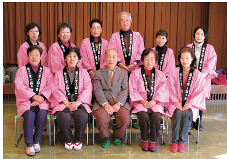
「越生の里を踊る会」のメンバーと

★『平戸海峡』は全国カラオケに搭載されていますね 現在、この曲と『唐船岬』が収録されたCDが全国で発