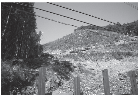
小杉太陽光発電工事現場

は信義に従い誠実に行うこと、権利の乱用禁止」の基本原則を定めている。これによるとこの工事は非常に疑問だ。どう考えるか。また、地元住民及び町道の通行者は大きな不安を抱いている。各農地安全対策をどう指導しているのか。 答 危険な場所への設置であることは町も十分認識している。指導内容は、自然災害・2次災害の防止事項、雨水での土砂流出等の安全対策、台風時等の監視管理体制・対応、擁壁設置、落石防