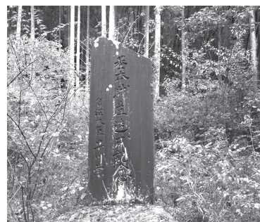
町財政基盤確立の碑

答 防犯活動をしていただいている団体の情報交換会を12月に予定しているので、その場で意見を伺いたいと考えています。