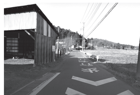
緑の側線非標示区間

制度の概要は。価格低下なども含め収入減少を補てんする。農家への周知状況は。説明会が平成29年12月26日に吉見町で開催され、担当課の役割は。埼玉県農業共済組合が相談窓口。担当課としては関わる必要があれば協力。災害で収穫前に落下した梅、ゆずなどは保険の対象になるのか。