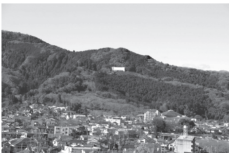
越生町の玄関にそびえる世界無名戦士之墓

答 留学生が本施設を知る絶好の機会にもなり、インターネットメディアを通じて海外に発信することも大い