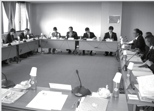
千代田町での研修