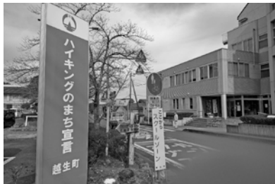
みんなでつくる「ハイキングのまち」

レッキング部との連携もますます進めたい。ハイキングのまち宣言から5年が経過し、越生町と言えはハイキングという認識が浸透してきているんだからこそ、宣言の基本に立ち返り、町民の理解と関心を深め、町全体でハイカーを歓迎するという機運やおもてなしの心の醸成に取り組む必要があると考えている。