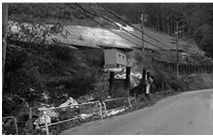
小杉地区ソーラー開発現場・2021年12月6日撮影