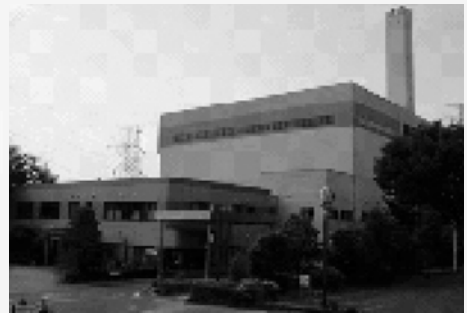
高倉クリーンセンター（現在）