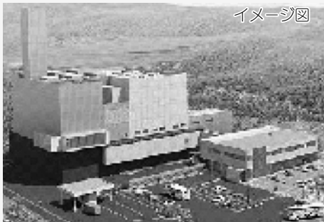
埼玉西部クリーンセンター