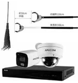
防犯に必要なものは?