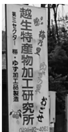
かわいいうめりんと、入り口看板

あるが、この場での返答は無用。今まで定例会で質問を重ねたが、(株)特産と執行部の間には、守秘義務があり、議会での質疑には限界を感じる。そこで、手遅れにならないために提案したい。