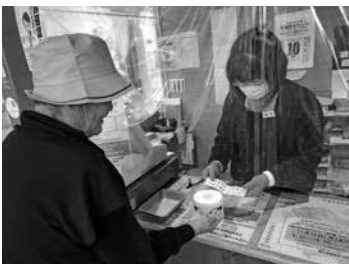
「うめりんお達者倶楽部」の利用者さん

答 地場産の食材を使用することは、子どもたちにとって食育の観点からも大変意義がある。今後、課題をクリアするため、農家と中継してくれる人がいれば考えやすい。