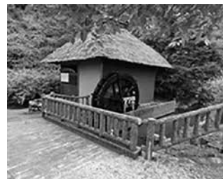
山吹の里歴史公園の水車小屋

の破損箇所と併せて修繕工事を行います。 問 大クスの掲示板は、前で見えるように出来るか。 答 解説板は、仮に登り口に設置してあります。 問 梅林に整備された、見晴展望台は、撤去されたが、再建するのか。 答 再建を望む声もあり、更なる有効活用が図れるよう調査研究をします。 問 長期総合計画の中で土地利用活性化推進ゾーンの活用方法は。 答 法令等の要件が合えば商業系に限らず交通利便性を活かし、沿線の活性化の推進を図ります。 問 バイパス沿いに、町おこしで、「越生独自の道」を誘致出来るか。 答 建設に数億円かかり、