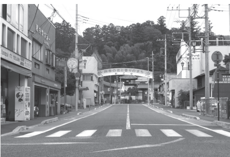
「何も変わらない」でいいのか