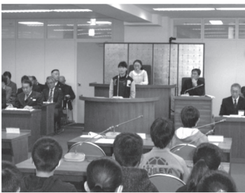
堂々と発言する姿には感心します

子ども議会を開催 6年生の目線と気づきで 6名が一般質問に登壇 12月17日午後1時30分より、第7回子ども議会が本会議場で開催されました。インフルエンザで欠席の児童もあり、6年生62名の子ども議員が出席し、代表6名が執行部に対し一般質問をおこないました。どの質問も、この町をよくしていこうという視点からの内容で、論述されていました。併せて、「あいさつ推進宣言」が発議され、賛成全員で可決後、全員で宣言文が唱和されました。主権者教育の一環として、議会でも高く評価し全議員が、その様子を見守りました。未来のこの町を背負う子どもたちが頼もしく見えま