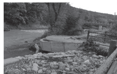
越辺川及び遊歩道の被害状況