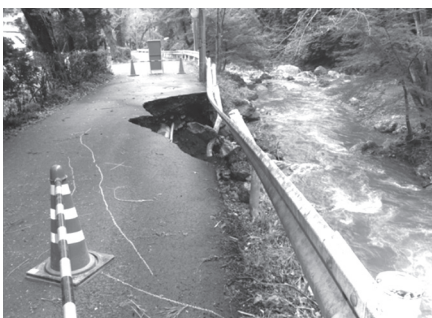
龍穩寺前の道路の陥没

今回の台風19号による復旧費用について、一般会計補正予算が計上されました。災害復旧費の総額は、9289万7千円。内訳は、国庫3341万5千円、民間（小杉太陽光発電業者負担分）257万4千円、災害復旧債2970万円、一般財源2720万8千円となります。