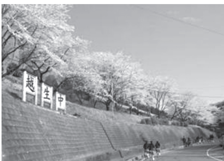
越生中学校坂道 (ホームページより)