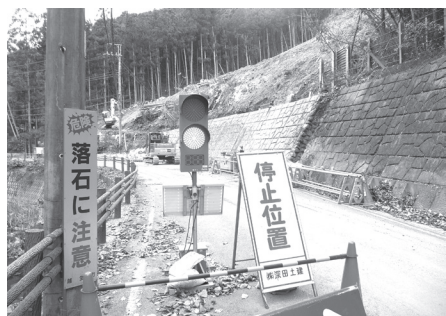
小杉メガソーラー現場