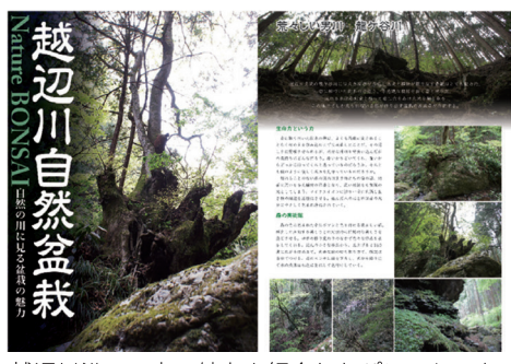
越辺川沿いの森の魅力を紹介したパンフレット

私は熊本県の天草出身です。天草といえば海というイメージですが、森のめぐみもたくさんあります。本当に田舎で、