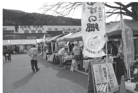
ゆずフェアから梅祭りに賑わいをつなげたい梅の駅

その後、議会に議案上程され審議の結果、オーティックは可決され、梅の駅は否決となった。