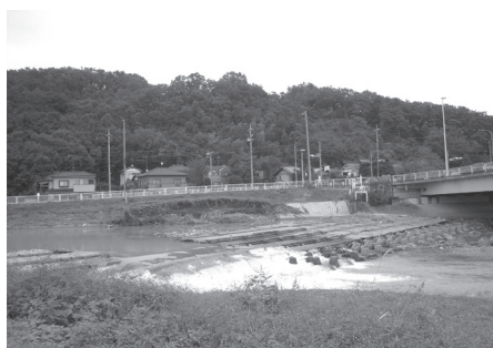
如意堰一部決壊・護岸洗掘