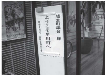
早川町訪問 現代的新機構庁舎

て栄えていました。その下町の商店街「御田町」で活性化が続いています。議長の挨拶の後説明をしてくださったのはNPO法人「匠の町」しもすわあきないプロジェクトの方でした。その町には、古くからの仕組みが今も根付いており、それが外部からの人の受け入れに大きな成果を上げておりました。「ご縁の力」「地域の力」「存在の力」