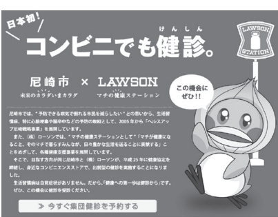
尼崎市のコンビニ健診

県内28の自治体が実施している。大手企業が存在している下での成功であると考えている。