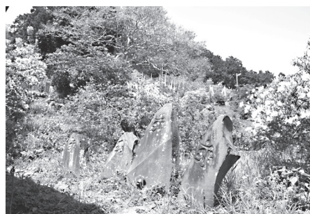
鈴木金兵衛巡拝碑