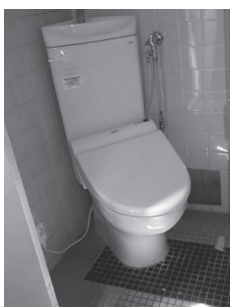
狭くて使いづらいトイレ

隣の自治体では5千円を補助している。今後の研究課題とする。④今後、検討しなければならぬ課題と考える。