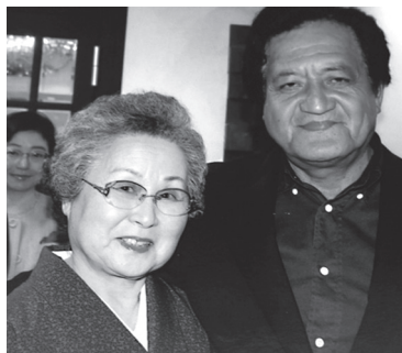
ゴーギャンの孫タイ・マルセルさんと