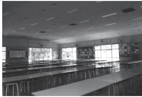
越生中学校のランチルーム