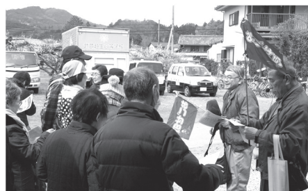
越生梅林の観光ボランティア