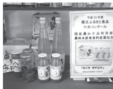
ゆず之介などの商品

答 傍聴は可能。展示会は6月19日～7月4日。坂戸教育センター。ホームページで公開。