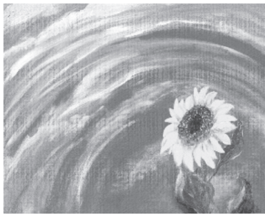
ミラノ万博に出品される作品「生きる輝く」

「まったく描きませんでした。最初は水彩画だったのですが、自己流で油絵をはじめました。デッサンを習ったことがないので、キャンバスに直接絵筆で描きます。まず、キャンバスを真っ黒に塗りつぶすことから始めるのですが、それもまったく自己流です。」