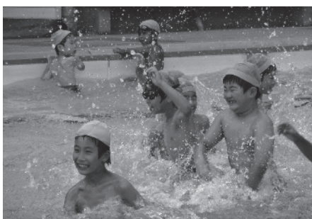
越生小学校のプール授業