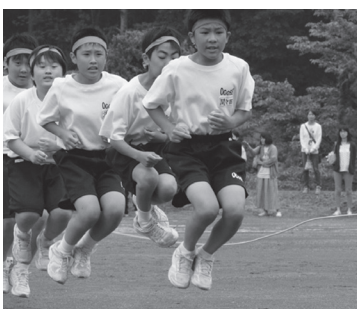
越生中学校体育祭

ラスだが、35人学級で26人3クラスになっていく。仮に、61人の学年の場合、31人、30人の2クラスが、35人学級だと21人、20人、20人の3クラスになり、よりきめ細かな指導ができる。町の財政では35人学級が限界だ。30人以下学級の実現には国・県の財政負担が必要だ。教職員の超多忙化防止策では町職員の配置、パソコン貸与等でデータの共有管理で負担軽減、「ふれあいデー」での定時退勤の推進。