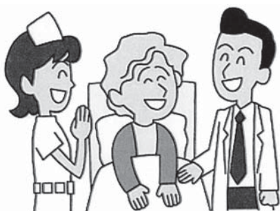
早期発見で笑顔満開！

766万3千円が繰入金として国保特別会計に計上され、法定外繰入金金の内の4232万円は保険給付費不足分だということだ。これを何とかしなくてはならないと思わないか。古来より『先憂後楽』という四字熟語があるが、人間ドックの窓口精算・補助額を引き上げること受診者が増えなくても早期発見が医療費の削減につながる。補助額を見直すのは今年度、今ではないか。 答 人間ドックの窓口精算と補助額を2万5千円に