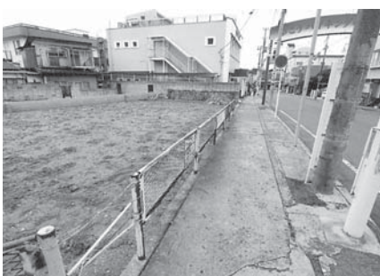
経年劣化でペンキの剥がれた歩道