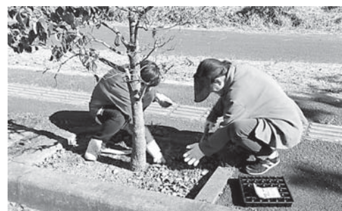
越生東での越辺川の河川美化活動

実現したのか。 答 ①町長自ら3月にJR東日本、4月に東武鉄道に申し入れた。公約なので早期に実現できるよう、引き続き鉄道事業者に要望する。②3月に財団法人育てる会を訪問。5月に山村留学を行う群馬県上野村と長野県北相木村を視察した。 問 越辺川再生事業の更なる充実。 答 いこいの広場駐車場へのトイレ設置が可能となり設計の予算計上。水道につ