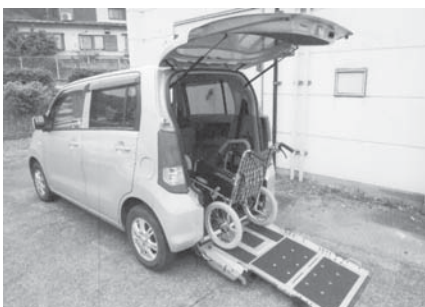
介護用リフト付き車両