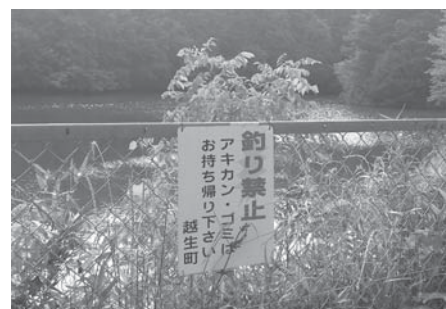
大亀沼の釣り禁止看板

ある。両沼への侵入防止の対策は。 答 インターネット等情報の伝播については、情報化社会の中で防ぐことは困難。転落事故等を未然に防止するため今後も警察に警ら活動の強化をお願いし、侵入防止に向けた取り組みを進める。 問 観光PRから災害情報まで、自治体のLINE活用が広がっている。越生町も「うめりん」を登場させて、週1、ピンポイントで情報を発信してはどうか。