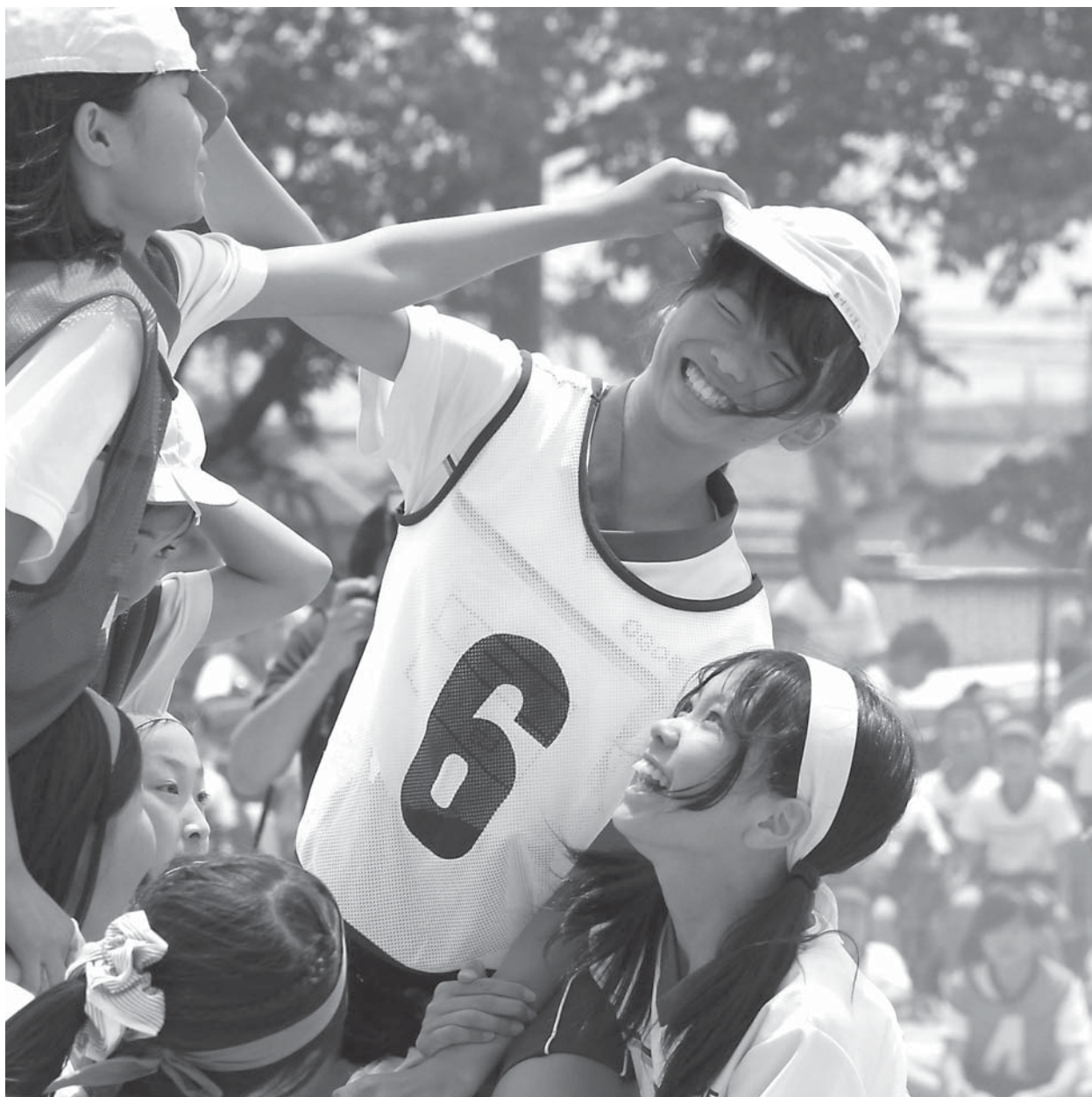
越生小学校・運動会