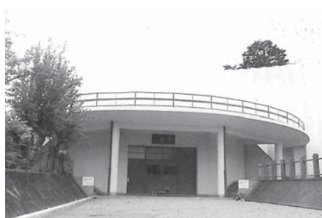
ビュースポットになる白亜の塔

経緯からと推測。③顕彰会内部の問題だと理解。④毎年43万円の県補助金があるが、経費負担で財政面の調整が困難であった模様。⑤霊廟バルコニーにスカイツリーを中心にした鳥瞰図的な写真を設置。⑥実行委員会で運営、町もその一員。⑦財団の中で課題。⑧白亜の塔は世界平和の象徴であり、築50年を経過し登録文化財も視野に入れ、顕彰会とも相談し検討。