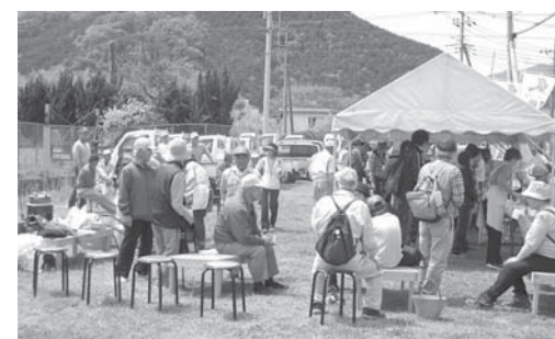
ホッと一息、ハイキング客へのおもてなし

課とで案内看板を含めて検討する。②仏像の収蔵庫は、県生涯学習文化財課から文化財保存事業の補助対象となるのは困難であると回答。文化財保護の観点からも、平安時代から江戸時代までの生きた歴史資料の宝庫である五大尊の再発見・再評価につながる意義ある事業だが標柱や説明板の設置など104基ある石碑の取り扱い、建立方法、事業費の捻出と多大な問題がある。観光資源になる鈴木金兵衛の句碑について碑文、札所写し