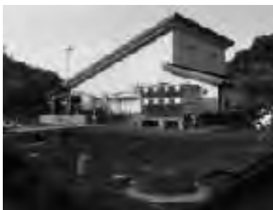
水道課膜濾過施設

料金体系は政策会議や水道審議会を通じ検討する。一般会計からの補填については、設備更新の新たな起債も含め今後の課題とする。