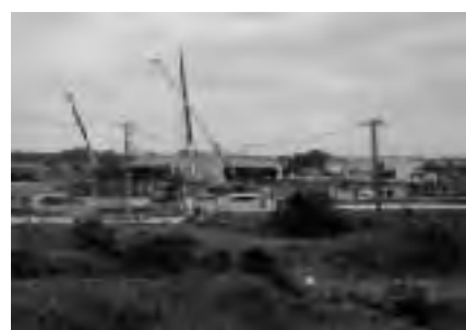
工事中の坂戸西スマートインター

対応ができています。③空き店舗の利用については問題も多く、早急な対応は難しい。アンテナショップ開業には費用も掛かり、一時的なイベントの開催が望ましいと考えている。商工会などと協議しながら、一店逸品運動やB級グルメなどを起爆剤として商業の振興を図りたい。現在サービスエリアでイベントや観光キヤンペーンを開催し、特産物の販売もしているが、坂戸西スマートインターチェンジ近くやサービスエリアにシヨッ