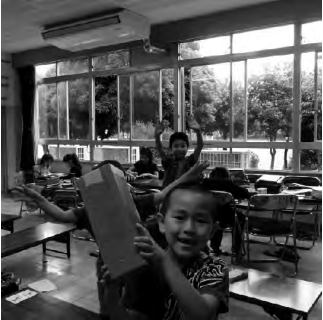
素敵なお顔をのこども