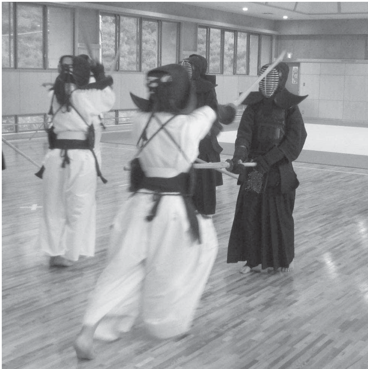
新設された越生中学校武道場