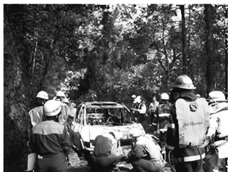
火災予防の啓発看板の設置なども含め検討していく。