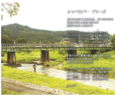
CD「オッペリバーブリーズ」より

はい。2002年頃、1年くらい一緒にライブをしていました。コミックバンドのようなのですね。僕の所属し