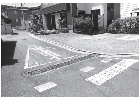
消えて薄くなった路面標示