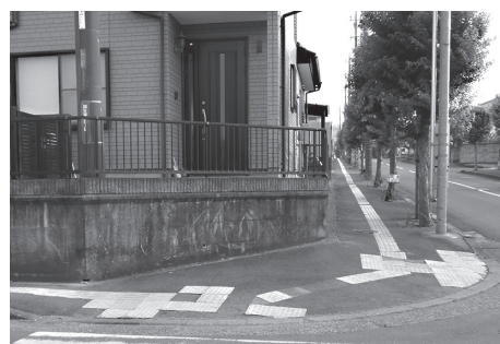
剥がれた点字ブロック