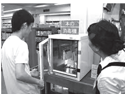
書籍消毒器を利用する

店舗設置型充電器の設置は、相応の経費が掛かるので、家庭用充電器を活用して、充電ができるよう検討していく。