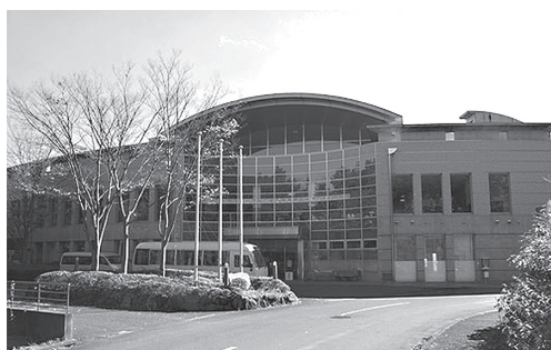
ゆうパークおごせ