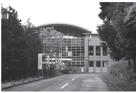
正面から望む「ゆうパークおごせ」

朝霞市との連携事業 総合行政システム整備事業 町営樹木葬墓苑整備事業 おごせ6次産業化パワーアップ総合対策事業確定の返還金 小中学生学力サポート事業