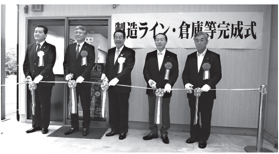
製造ライン・倉庫等の完成式典

ゆうパーク検討委員会 6月13日、議会全員が出席し、町が行った町民に対するアンケート結果をもとにして、議員の活発な意見交換がありました。