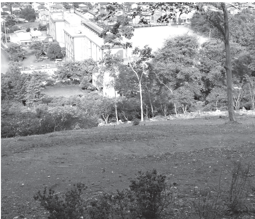
急斜面の樹木葬墓苑予定地の真下には越生小学校

少子高齢化社会の進展により、墓地等の維持管理の継承者が不明となる場合や継承を望まない方が増加するともに、葬儀の簡素化が進んでいる状況を踏まえ、町民等の公的な福利厚生の利用に供するためと、設置の趣旨が示された。また、説明の中で、初期投資と向こう30年間の維持管理費が約1億円で、墓苑の使用料収入は、最大でその10倍近くが見込めるという財源確保策の訴えもあった。