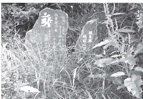
草に埋もれる巡拝碑

なるものと思う。①草が茂ると巡拝碑が隠れてしまう。定期的な管理を、どう考えているのか。②記念碑そばの坂道に手すりの設置を。③観光ボランティアの養成も必要と思うが。 答 ①年4回程度園内の草刈りを実施している。状況をみて必要があれば随時草刈り等を行う。②公園整備にあわせて園路も計画的に整備して行く。③1月29日に観光ボランティア講座を開催したが、登