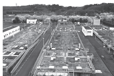
毛呂山・越生・鳩山公共下水道処理場

化槽へ転換する場合、国と県と町で補助金を交付しています。5人槽の場合は41万2千円、10人槽で62万8千円です。また、既存の浄化槽などの撤去費用として上限9万円、配管費として上限15万円の補助制度があります。補助額については、昨年度から浄化槽設置費と処分費でそれぞれ3万円、配管費で2万円を上乗せしています。合併処理浄化槽の維持管理費については、平成26年度から上限1万円で保守点検費用と浄化槽の水質