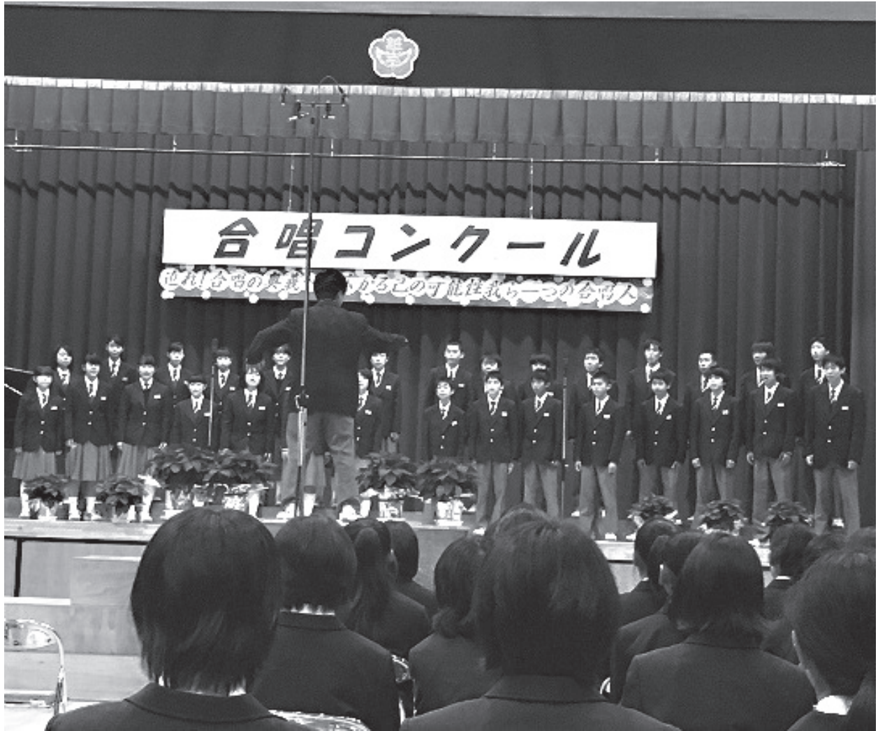
「迫れ合唱の奥義へ」を合言葉に開催された越生中合唱コンクール