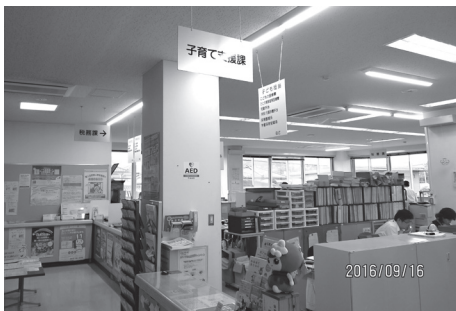
子育て支援課窓口