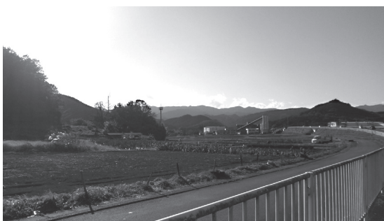
大谷地区の工事請負契約道路予定地