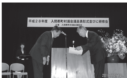
越生町議会議長に表彰状が授与されました