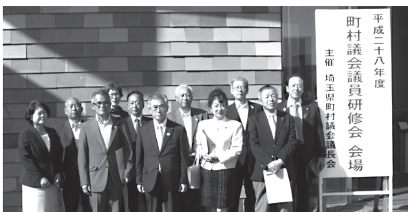
議員全員が「これからの防災・危機管理」を研修しました

講演は「これからの防災・危機管理」について 講師は、防災システム研究所所長の山村武彦氏