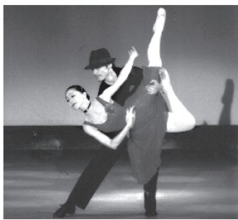
自作の小品「Di Nuovo」を踊る

・バレエとの出会いは みどり幼稚園に通っていた頃です。当時、みどり幼稚園でバレエ教室がありました。入園してすぐ、みんなの踊っている姿を見て、強く惹きつけられました。母に、自分も