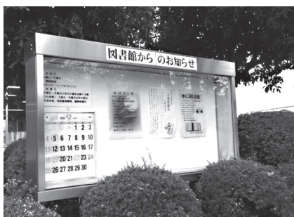
図書館からのお知らせ掲示板