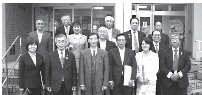
大玉村議会議員とともに

福島県大玉村議会運営委員会が、10月17日、左記の事項について、研修をするため、越生町議会を訪れました。当議会では、議長、副議長、各委員長、各副委員長が対応しました。 研修事項 ① 協働によるまちづくりへの参画について ② 越生町議会運営について