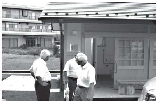
(上) 津久根地区内の公衆用トイレ (下) 拡幅された梅林周辺道路

その他、地方消費税交付金、地方譲与税、使用料及び手数料、ゴルフ場利用交付金があります。