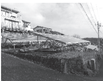
住宅街に設置された太陽光発電パネル