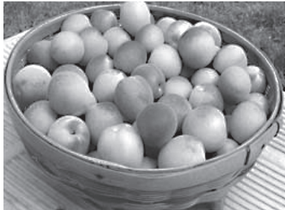
ブランド化が期待される越生の梅