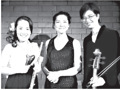
音楽ユニット「ルチェリーナ」としても活躍

地元の大分の大学も声楽科。友達や作曲家の先生とバンドを結成し、ヤマハのティーンズ・ミュージック・フェスティバル（旧ヤマハ・ポップコン）に出場して、県で優勝したこともあります。