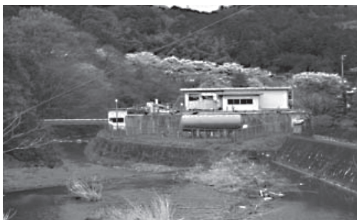
越生町浄水場 (大満区)