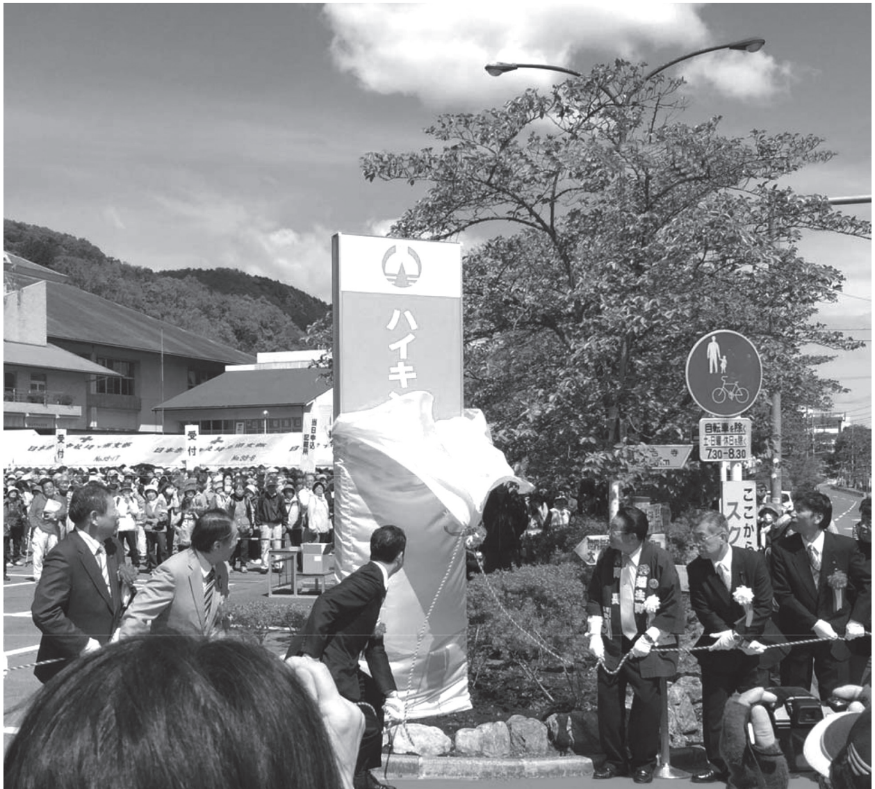
「ハイキングのまち」の宣言板除幕式