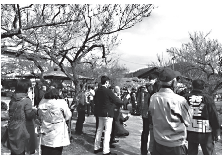
今年の梅まつりは観梅客で賑わいました