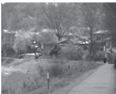
完成した越辺川遊歩道(黒岩地内)

路、ハイキングルート、梅林までの安全な歩行ルート活用。毛呂山町と両町共催、イベント等の開催も考えてまいりたい。