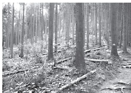
間伐された町有林