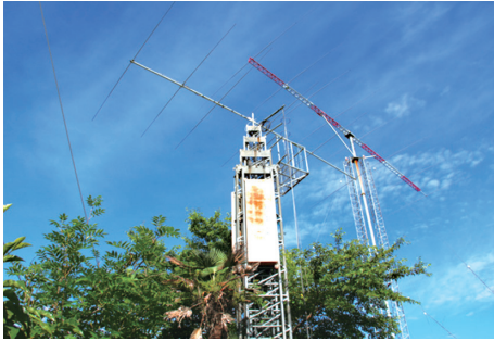
無線基地のアンテナ。これはほんの一部です。

国から電話や手紙が殺到しました。アマチュア無線が脚光を浴びることなどない時代、テレビの人気番組で取り上げられ、無線マニアにとっては驚きだったようです。