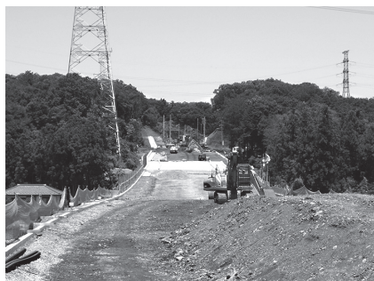
飯能寄居線工事現場

答 バイパス区間のうち、信号機の新設を1か所、改良を2か所要望した。東口の開設に伴い、駅ロータリー周辺に防犯カメラを設置するなどの安全対策は。