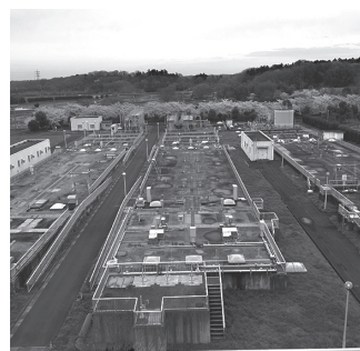
毛呂山・越生・鳩山下水道組合処理場

答 地方財政計画等を議員と情報共有するのは、意義のあることと考えている。今後、地方財政計画等の通知が来たら、議会に情報提供したい。