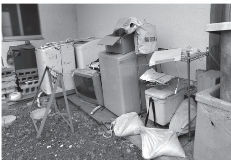
保健センター裏側のトイレ入口の集積場の現状