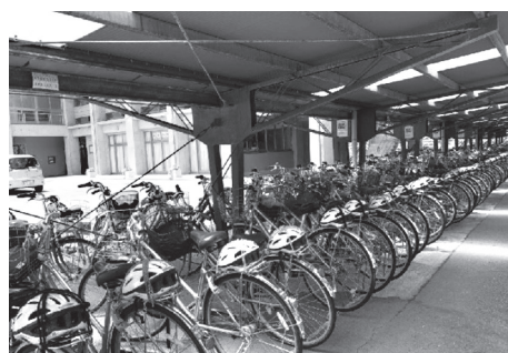
マナーの良さがうかがえる越中自転車置き場

ところ助成は考えていません。 問 ①女性議会開催について考えをお伺いします。②男女共同参画社会について、越生町が取り組んだ施策等がありましたらお聞かせ下さい。 答 ①女性議会の開催については、県内の状況を注視しつつ議員の皆様にお諮りしながら検討して参ります。②平成8年度から越生町男女共生フォーラムを開催し、男女平等や女性の社会進出について講演会を行っています。また、審議会等に女性が占め