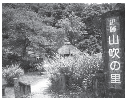
県指定旧跡「伝山吹の里」

る旨を載せるべきだ。また誘致PR用のぼり旗を作成すべきだ。③ポケットパークを「道灌広場」等の名称に変更したらどうか。また駅東口開設後、施設に「山吹」を付けた名称にしたらどうか。④山吹の里の駐車場は防護柵がなく危険だ。防護柵を設置すべきだ。 答 ①実行委員会の正式な要請があれば当町が幹事役になる。②町のホームページに掲載する。のぼり旗の作成も検討する。③ポケットパ