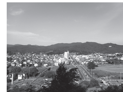
JR八高線西側には森林地帯がつづく

人住民税に千円上乘せされ、森林環境譲与税(仮称)は来年度から交付されるが収支関係は。②それで何ができるのか。③おのずと山林管理の仕 事が増えるが、森林組合だけに頼るのか。④林業を主として、梅やゆずの特産物栽培、地場産野菜の生産などで若者のビジネスモデルを作れないか。 を待つて決まる。③数は少ないが町内業者もいる。④木材価格の採算が合えば、可能性はある。