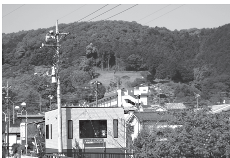
樹木葬墓苑予定地

答 ニーズ調査は行わない。 問 公共的な福利厚生とはどんな事か。 答 墓地の経営は、高齢者や低所得者などに関する施策として公共の福祉に資する事業であると考えている。 問 約4000㎡の斜面に對する雨水対策は十分か。 答 開発面積に応じた流量計算に基づき、適切に実施する。