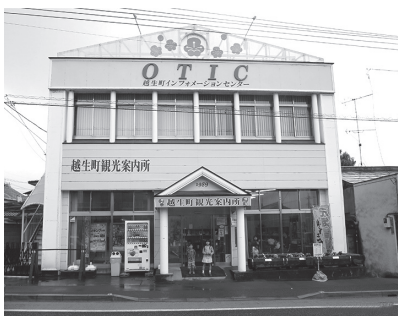
オーティックの中の一隅にある観光協会