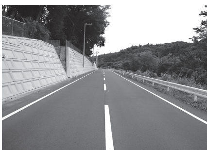
周辺整備で新しくなった 鹿下地内町道1-10号線