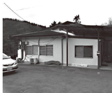
越生特産物加工研究所

問 監査役の業務監査の実施方針を伺う。 答 監査役による監査は、会計に関わる売掛金、買