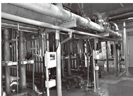
越生町浄水場膜ろ過施設

問 繰越赤字が平成27年度末約9663万円。赤字を消すには2千万円の利益で約5年かかる。料金改定で何か終わったような感覚があるようだが、今後の収益を考えると危険な状況では。本当は、これから重要な時期では。 答 給水収益は給水人口の減少に比例して減少し水道事業の経営状況は、さらに厳しさを増していく。更新計画策定の際には将来的な料金改定も視野に入れた財源計画の策定も当然必要。今後は、