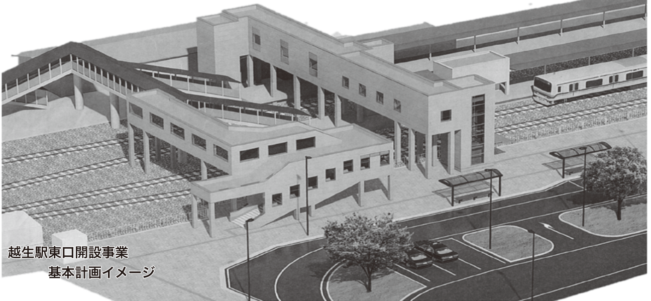
越生駅東口開設事業 基本計画イメージ