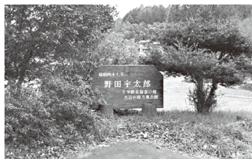
大谷ケ原万葉公園

答 今後、高齢者の利用も増えると思われるので健康づくりに配慮した公園整備を検討したい。