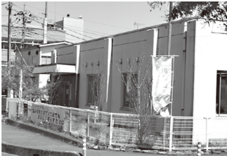
保健センター向かいの社会福祉協議会

地域包括支援センターの業務が、社会福祉法人越生町社会福祉協議会に委託されました。