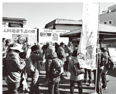
月例ハイキングの出発点ポケットパーク

問 近隣町においてはスポーツジム等があり、当町よりの利用者が多いと聞く。越生町にも「ゆうパーク」にスポーツジムがある。他の施設より高額で、会員制で、あまり利用が見えない。もともと町民の福祉と健康のための施設。高い使用料金で利用されないより、低料金で多くの町民が利用できるようにすべき。