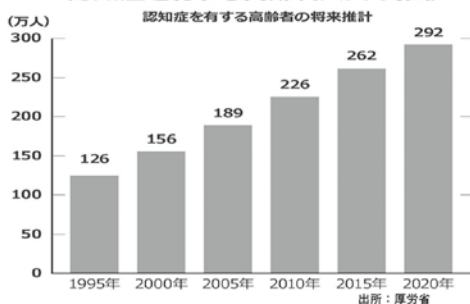
認知症を有する高齢者人口の推移