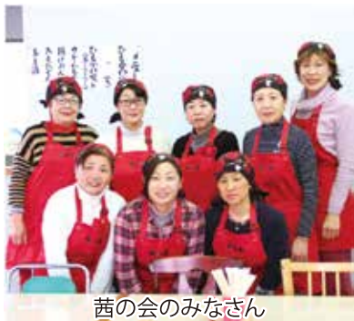
茜の会のみなさん

でも私、この会に入るまで一度もひもかわを作ったことなかったんです。会の先代に打ち方から味付けまで教えて頂きました。ひもかわによる