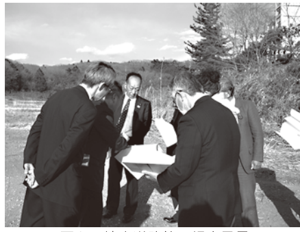
西和田地区内道路線の視察風景

町道2-34号線道路改築工事(大谷地区) 変更前の工期 議会議決の日から平成29年3月15日まで 変更後の工期 議会議決の日から平成29年6月30日まで 賛成全員 可決