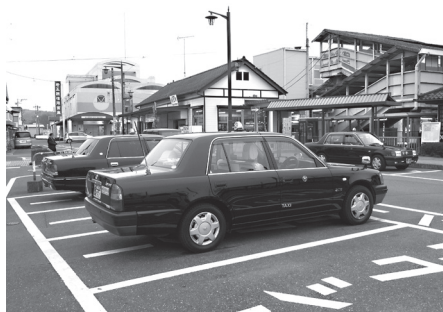
(高齢者の)地域交通の核となるタクシー

答 ①500円のタクシー券を一定枚数交付、町内での利用を原則に1回の乗降で1500円までの利用。②所得制限は設けない。③対象は70歳以上の車を運転できない方。④バス利用促進策も併せて検討中。⑤実証的に開始