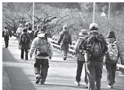
意気軒高・月例ハイキング大会

答 越生町ホームページ「子育てナビ」はスマホでも対応しているので、まずは、「子育てナビ」の情報発信を充実させたい。アプリについては調査研究をしていきたい。 問 ①若年層への選挙啓発の取組みは。②ポスター掲板上にQRコードの掲載を。 答 ①町独自のポスター作成や啓発資料の配布等、投票率向上に向け、積極的に取り組む。②有権者に広く選挙啓発を行うためには、QRコードは非常に有効な手段と考える。検討