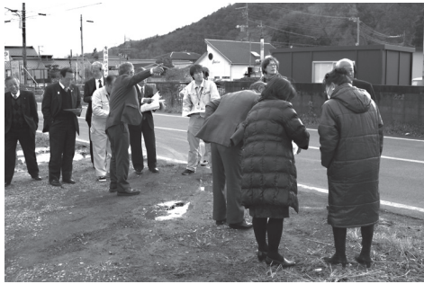
議員全員で認定、廃止場所を現地視察