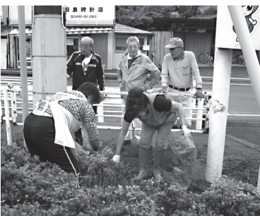
河原さくら会の清掃活動

平成29年度は保健センターの雨どいの修繕を行う。今後は公共施設劣化状況調査表に基づき、優先順位を付けて対応していきたい。