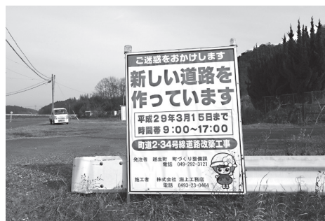
大谷地区道路工事

町内で上履き取り扱いは1店舗、小学校の体育着と中学校のジャージについても取り扱いは1店舗であるため、急に必要になった時や、仕事のため開店時間に購入できない保護者に不便をかけている。不便解消のために取扱店と学校、教育委員会も間にはいり、今後複数箇所で購入できるよう検討をしている。一時的措置として学校での貸し出しや指定外のものを利用