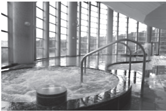
ゆうパークおごせの浴場

平成27年11月指定管理の継続が難しいと指定管理者シダックス大新東ヒューマンサービス（株）からの申し入れを受け、平成28年度は、納付金無しとなりました。