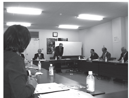
川上村にて説明を受ける様子

川上村のレタス作りは1950年頃から始まり、稲作や果樹栽培に不向きな気候、そして交通の便の悪さなど、様々な悪条件を克服しレタスの一大生産地になっています。先人の創意と努力、そして近年にあつては官・民共同し、先進的な取り組みを企画し、実行することにより、国や県、マスコミ等が注目し評価が上がり、事業推進が非常にスムーズに進んでいます。