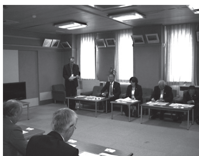
小布施町での研修風景

ヨーロッパ研修を企画し、町民派遣を9年間実施、今、百軒の家庭のオープンガーデンとして結実しているそうです。また、平成24年から35歳以下の学生や社会人を対象に参加者を公募し、「小布施若者会議」を始めました。自治体による若者会議の先駆けて、全国から集まった若者同士で議論によって新しい価値を生み出そうという意欲的な試みです。まちづくり先進地として、大学の研究者やまちづくり関係者との交流が活発に行なわれています。