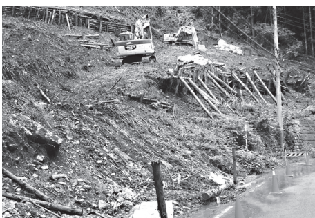
小杉地区太陽光パネル工事現場