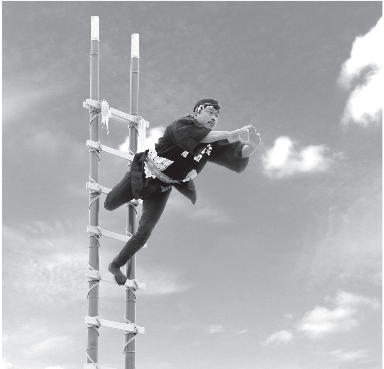
西入間広域消防組合の出初め式 (比企鷲土木工業会によるはしご乗り)