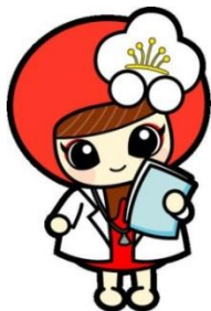
越生町のマスコット 「うめりん」

一般的な食品の加工では、芽胞を殺すことはできないので、芽胞が含まれている食品を食べさせないことが大切です。