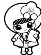
埼玉県けんこう大使 越生町のマスコット 「うめりん」

会場：越生町保健センター 日程：8月、3月 広報等でご案内します。 献血は身近なボランティアです。ご協力をお願いします。