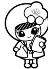
埼玉県けんこう大使 越生町のマスコット 「うめりん」

会場：越生町保健センター 日程：広報等でご案内します。 献血は身近なボランティアです。ご協力をお願いします。