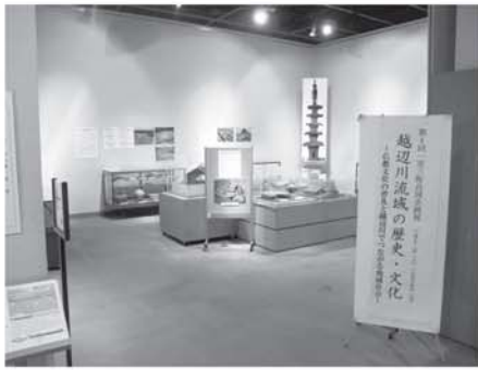
展示（毛呂山町歴史民俗資料館）

越辺川を通じて、原始・古代から今日に至るまでの歴史に焦点を当て、坂戸市・毛呂山町・鳩山町と越生町の一市三町で開催している「越辺川流域の歴史・文化」展も、今回で四回目を迎えました。今年には「仏教文化の普及と越辺川でつながる地域社会」と題し、古墳時代の終わりから、奈良・平安時代に広まった仏