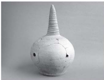
柳原 A 遺跡出土 香炉形須恵器（鳩山町）

教文化について展示します。展示では、遺跡から出土した遺物のほか、パネル写真などで遺跡の魅力を紹介します。日本古代における仏教の伝来は、六世紀半ばの欽明天皇の頃に百濟より伝えられたとする説が有力です。関東地方では、古代寺院の創建が活発になるのは、律令体制が整う七世紀後半と考えられます。坂戸市北東部の台地上に位置する勝呂廃寺は、埼玉県内で最大規模の古代寺院で、七世紀末頃から平安時代まで存続したと考えられます。発掘調査では庇をもつ建物、塔などが発見されています。また、鳩山町を中心とした丘陵地帯には、東日本最大級である南比企窯跡群があり、寺院で使