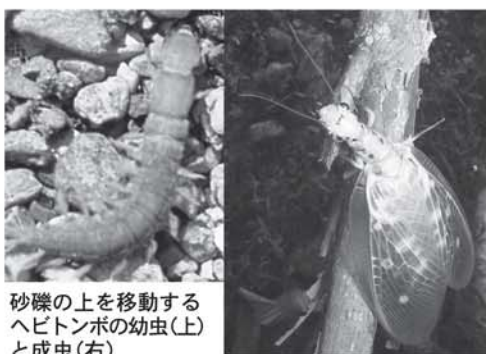
砂礫の上を移動するヘビトンボの幼虫(上)と成虫(右)