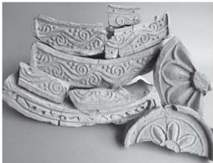
新沼窯跡出土瓦（鳩山町）

越辺川を通じて、原始・古代から今日に至るまでの歴史に焦点を当て、坂戸市・毛呂山町・鳩山町と越生町の一市三町で開催している「越辺川流域の歴史・文化」展も、今回で四回目を迎えました。今年には「仏教文化の普及と越辺川でつながる地域社会」と題し、古墳時代の終わりから、奈良・平安時代に広まった仏