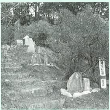
石碑設置状況（五大尊堂近く）

五大尊で、札所巡拝碑の設置工事が順調に進められています。江戸時代に五大尊境内に建てられた碑と、新造した碑を合わせた188基の巡拝碑（札所写）を花木公園全域に配列し、四国八十八ヶ所、西国坂東秩父百観音の「写し霊場」を整備しています◆江戸日本橋の商人、鈴木金兵衛の未完の夢を平成の世に成就させる事業は、今月末には完成の予定です。地域に眠る文化財の掘り起こしにより、つじの名所として知られる五大尊が、歴史公園として、新たな魅力を放つ観光地に生まれ変わります。