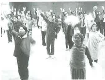
▲介護予防指導員による体操教室

期日 4月7日（毎週木曜日） 時間 午後1時30分～3時 場所 やまぶき公民館 持ち物 飲み物、スポーツシューズ、タオル ※申込不要、やまぶき公民館へ直接お越しください。