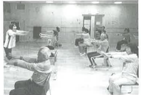
▲元気・ながいき体操教室

○元気・ながいき体操教室 ゆうパークで健康運動指導士による介護予防運動教室を開催しています。栄養や口腔の講義もあります。 期間 5月～8月（週1日、全14回） 場所 ゆうパークおごせ