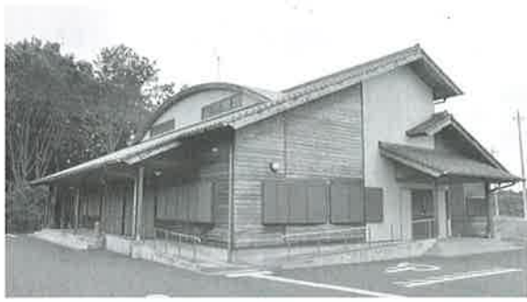
地域交流センター外観

越生町地域交流センターの「会議室（15帖）」は、8月1日から利用ができなくなります。10月1日に高齢者の就業確保の充実のために、越生町生きがい事業団が法人化し、シルバー人材センターとして発