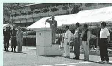
▲防災訓練(閉会式)にて

導のもと、中央公民館駐車場で実施されました。越生町は比較的災害の少ない地域ですが、災害は何時やって来るか分かりませんので、訓練によっていざという時に備えておく必要があります。今年度は梅園地区が対象で、参加された240名のみなさんは真剣に13種目の訓練や体験に取り組みられました。また、日赤奉仕団と陸上自衛隊による炊き出し訓練のカレーライスも大変好評でした。