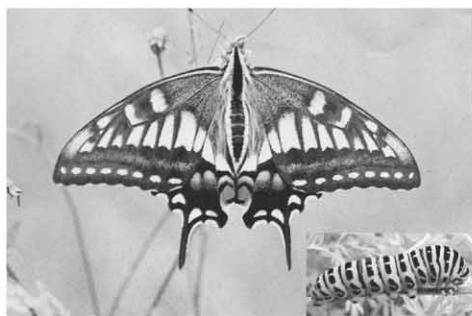
キアゲハ成虫と縞模様の終齢幼虫

キアゲハはアゲハに似てい ます。ただ、アゲハより黄色 いこと、また斑紋も異なっ ていることから、慣れれば区別 することは容易です。成虫は 樹間を飛ばず、草むらの上を 飛びます◆本種は北半球北部 に広く分布しており、日本で も食草のある低地から高山ま で分布しています◆幼虫はミ カン科を食べるアゲハ、クロ アゲハなどと違い、セリ科の 植物を食べ、栽培しているニ ンジンやアシタバも食べます。 埼玉県の低地では成虫は年 2・3回発生します。1回目 の成虫(春型)は美しい姿を しています◆特異なのは終齢 幼虫です。キアゲハと同属の アゲハ類の終齢幼虫は緑色で すが、キアゲハの終齢幼虫は、 黒と黄緑色の縞模様になる