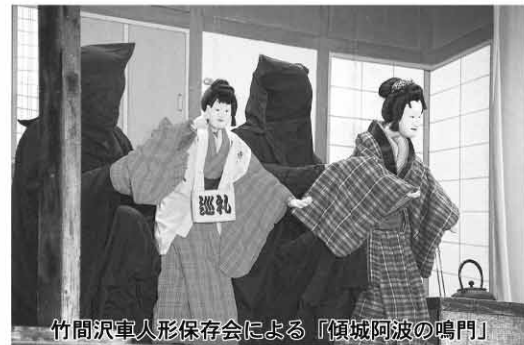
竹間沢車人形保存会による「傾城阿波の鳴門」