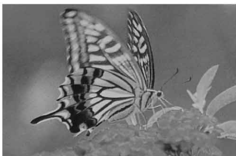
ブツレアに訪花したアゲハ

幼虫が蛹化し、蛹で越冬します。越冬蛹は食樹からかなり離れた板塀や家屋で見られることが多く、食樹で見られることの方が稀です ◆蛹には緑色系と褐色系があり、この色の決定は終齢末期から前蛹期にかけての周辺環境に影響され、周囲の色彩だけでなく匂いも関係しているようです ◆春の成虫はツツジ類やレンゲなどに、夏の成虫はザクロやヤブカラシなどに訪花します。また、晴れた夏の日中には、樹木の周辺を一定のルートで飛行している姿が見られます。このルートは蝶道と呼ばれており、蝶道を飛翔するのは雄だけです。(菓瀬 司)