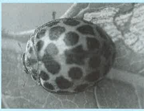
オオニジュウヤホシテントウ成虫と食害痕

オオニジュウヤホシテントウ「コウチュウ目テントウムシ科」ジャガイモやナスを栽培すると、斑紋の多いテントウムシが飛来して葉を食べて困ることがあります。多くはオオニジュウヤホシテントウですが、それよりやや小型のニジュウヤホシテントウの場合もあります。前者は「大きな二十八の星のあるテントウムシ」の意味です◆この種は、地域的な変異が多いことが特徴です。すなわち、食べる植物の