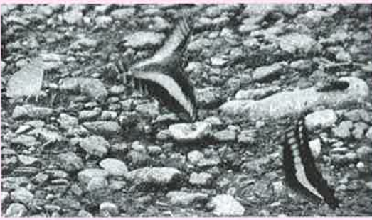
水を吸いに集まったアオスジアゲハ

越生町の「上谷の大クス」は、知る人ぞ知るパワースポット。夏の暑い日に、その木陰で涼めば元気が沸いてくることでしょう◆クスノキといえば、その葉や枝にカンフアーという化合物を多く含むので、多くの昆虫類、ムカデ、ネズミ等への忌避作用があり、古来より防虫剤である樟腦 しょうのう の採取に利用されてきました。しかし「タデ食う虫も好