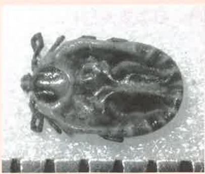
フタトゲチマダニ (スケールは1mm)

3年前の7月下旬、越生町越生で不思議な虫が発見された(写真)。調査の結果、その正体はマダニの一種「フタトゲチマダニ」でした◆2013年1月に国内で初めて確認されたウイルス感染症(重症熱性血小板減少症候群・SFTS)はこのマダニ類が媒介。人に感染した場合は致死率が6〜30%と報告され、関心が高まっています。さらに調査の結果、患者は西日本に集中しているものの、ウイルス