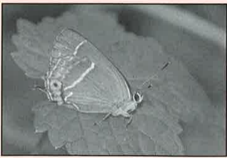
静止したミドリシジミ (裏面はオス・メス同じです)

ミドリシジミは平成3年の 埼玉県民の日に「埼玉県の蝶」 に指定されました。ミドリシ ジミは埼玉県を代表する蝶で す。このチョウは翅を広げ ると4センチほどの大型のシジ ミチョウで、翅の色はオスが 金色を帯びた緑色、メスは茶 色一色のものや青やオレンジ の斑紋があるものもあります ◆越生町でも大亀沼周辺の雑 木林で見られます。成虫が見