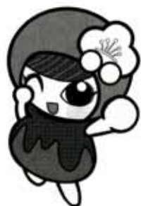
越生町のマスコット「うめりん」

問 ゆうパークおごせ(営業時間) 午前10時〜午後10時 / 休館日 毎月第1水曜日 TEL 292-7889 URL http://yupark.jp/