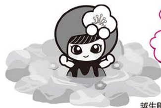
越生町のマスコット 「うめりん」