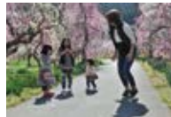
紅白の梅を跳めてのんびり過ごす