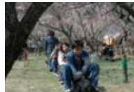
梅まつり期間中、園内をミニS/Lが走る