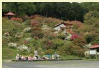
つつじの見ごろは例年4月下旬～5月上旬