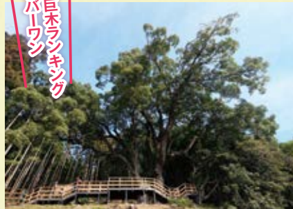
関東の山間部でクスノキがこれほど大木化するのは珍しい