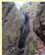
山肌に囲まれた落差14mの天狗滝