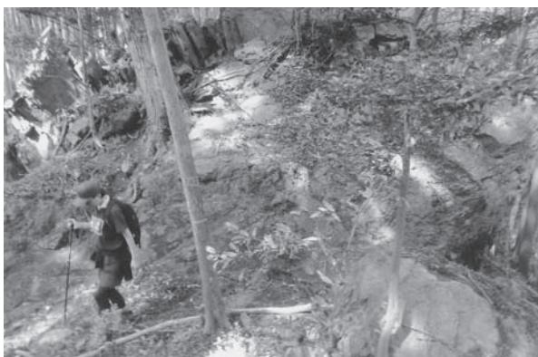
育代岩（後）からの下り