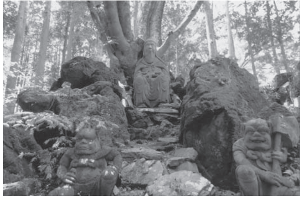
役行者像と前鬼と後鬼